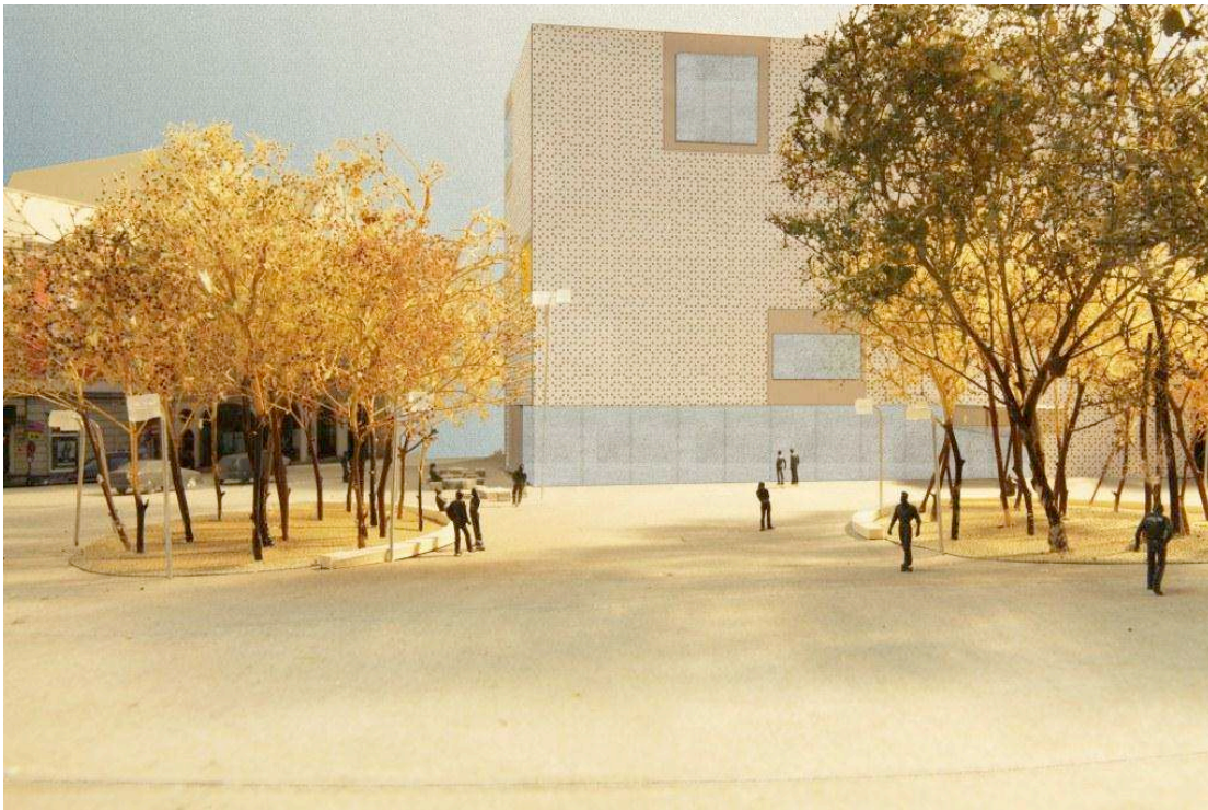
Abbildung 3: Modells des zukünftigen Kornmarktes. Foto und Modell: Büro VOGT, Zürich

Auch die Ansprüche an Design und Gestaltungsqualität sind hoch: Der Platz soll eine durchgehende Oberfläche ohne Niveauunterschiede, viel flexibles Mobiliar, eine grosszügige Beleuchtung bekommen. Der bestehende Brunnen wird erhalten. Ausgehend vom Baumbestand soll die Platzgliederung in erster Linie über Baumgruppen erfolgen. Die Grobkosten für die Neugestaltung belaufen sich auf ca. 1,9 Mio. Euro.