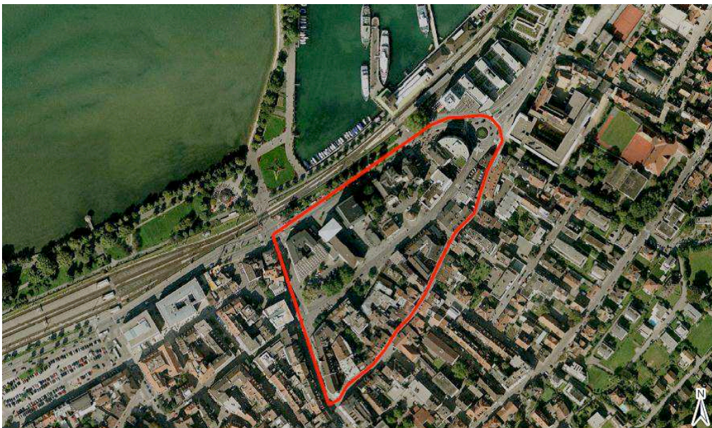
Abbildung 1: Kornmarkt und umliegende öffentliche Räume. Der Betrachtungsraum wird im Norden von der Seestraße, im Westen von der Rathausstraße, im Süden von der Anton Schneider Straße und im Osten vom Kreisverkehr bei der HTL begrenzt.