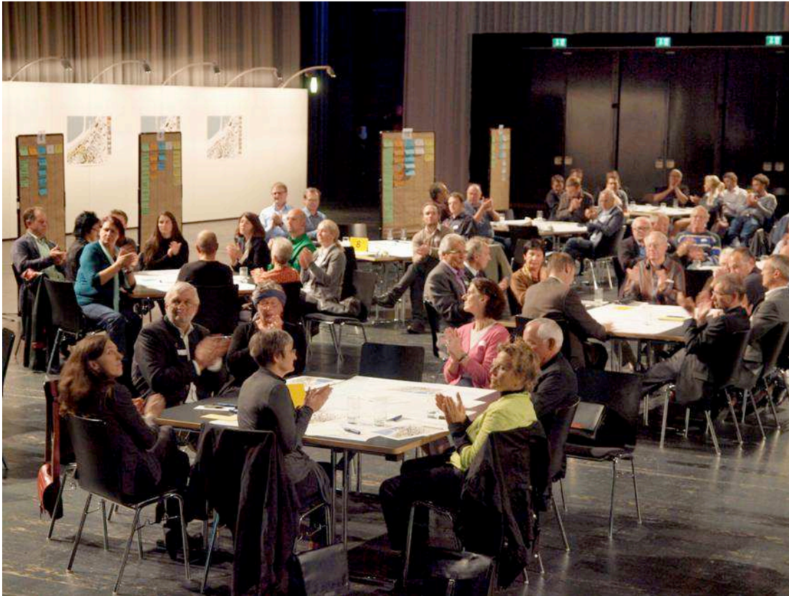
Abbildung 2: (Workshopsituation) Über 200 Bregenzerinnen Bregenzer brachten am 20. Mai 2010 im Festspielhaus ihre Vorstellungen zum neuen Kornmarkt zum Ausdruck.