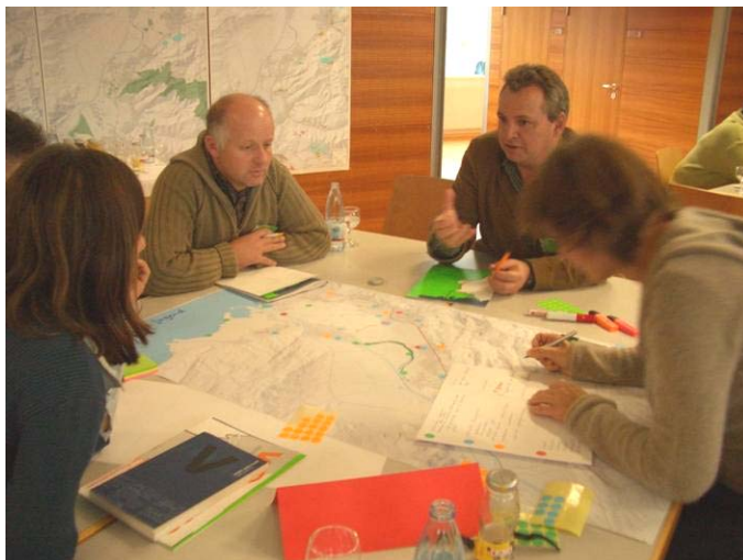
Bei der Planungswerkstatt am 27. November 2005 in Rankweil am Plantisch „Orte der Jugend“

_Zunehmende Separierung von ausländischen und einheimischen Jugendlichen. Ein Nebeneinander, besser noch ein Miteinander hat oft nicht funktioniert.