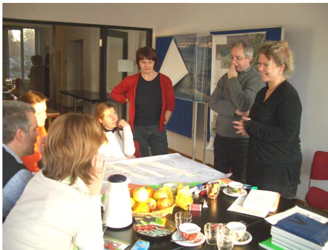
Think-Tank-Treffen von VertreterInnen aus der Jugendarbeit zu den Orten der Jugend im Rheintal

Die Jugend lebt das Rheintal als Ganzes – real und mental. Im Gegensatz zur »Erwachsenenwelt« ist die Jugend jene Bevölkerungsgruppe, wo alltägliches Verhalten und Wahrnehmung nicht auseinander klaffen.