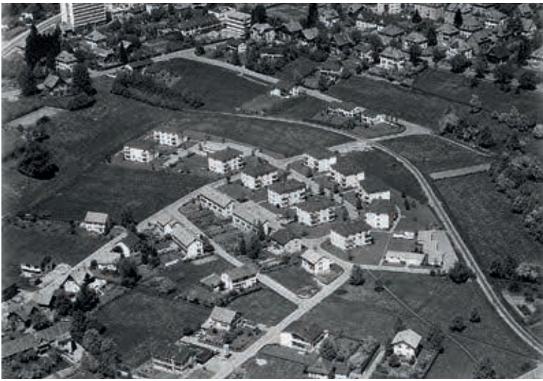
Die Wohnungsnot nach dem Zweiten Weltkrieg drängte zur Nutzung aller verfügbaren Flächen. In den 1950er und 1960er-Jahren errichtete die VOGEWOSI etliche Mehrfamilienhäuser – wie z. B. im Feldmoos/Weidach.

VOM KONSTRUKTIVEN UMGANG MIT WIDERSTÄNDEN