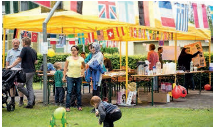
Von links nach rechts:

auch Eltern, Bibliotheken, Vereine und Wirtschaft zusammengebracht. Der frühe und gute Kontakt zu den Eltern ist der Marktgemeinde Rankweil ein großes Anliegen. Ein von der Gemeinde angebotenes Geburtspaket wird von über 70 Prozent der Eltern in der Elternberatung abgeholt und enthält unter anderem den mehrsprachigen Ratgeber »Sprich mit mir und hör mir zu«. Dort erfahren die Eltern auch über die Aktivitäten des »Netzwerks mehr Sprache.« Darauf können viele weitere Aktionen aufgebaut werden. Man trifft sich in mehrsprachigen Sprachencafés, beim interkulturellen Fest am Marktplatz oder schmökert in den öffentlichen Bücherschränken am Baggersee in Paspels.