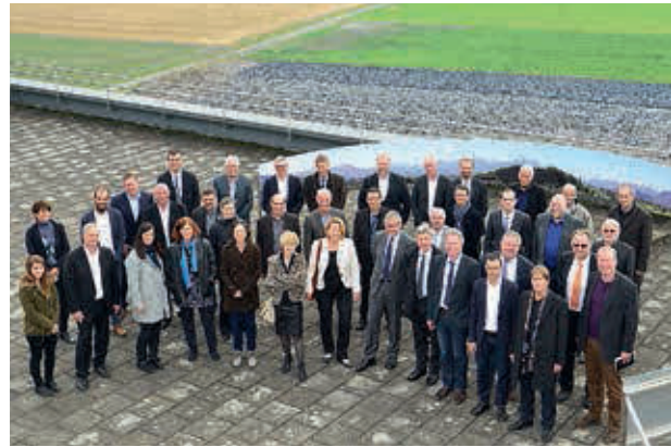
Der 6. Austausch Anlass fand am 10. November 2014 in Montlingen (CH) statt.

Am 10. November 2014 trafen sich zum 6. Mal die Bürgermeister, Bürgermeisterinnen, Gemeindepräsidenten und -präsidentinnen aus dem Vorarlberger und St. Galler Rheintal, um sich auszutauschen und die nächsten Projekte in der grenzüberschreitenden Regionalentwicklung zu diskutieren. Der Fokus lag dabei auf konkreten, rasch umsetzbaren Planungen. Die Projektvorschläge »Rheintal – das Radfahrta!« sowie »Grenzüberschreitende Freiraumplanung« werden nun angegangen. Neben den fachlichen Zielen geht es auch darum, dass die Beteiligten auf beiden Seiten des Rheins im Verlauf der Projekte voneinander lernen und so fit für weitere, komplexere Projekte werden.