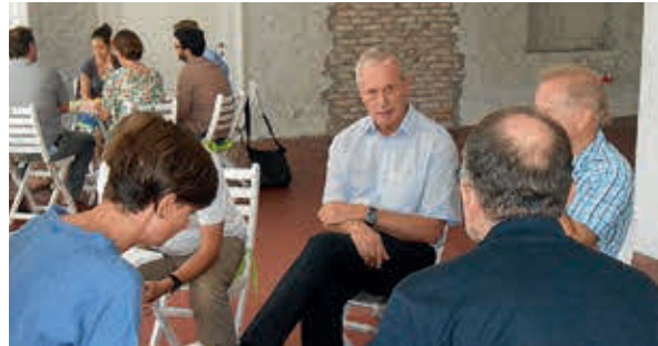
Am Planerntag, der am 6. Juli 2015 in Lauterach stattfand, wurden die Herausforderungen und Lösungsansätze zu den erhobenen Handlungsfeldern intensiv diskutiert.

Die Handlungsfelder 1–5 sind Kernkompetenz der Ortsplanung, die Handlungsfelder 6, 7 und 8 skizzieren den übergeordneten Aktionsrahmen für eine Innenentwicklung mit Qualität.