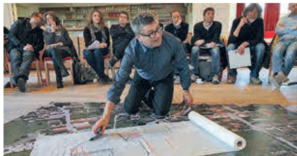
In der nonconform ideenwerkstatt® erarbeiten Bevölkerung und Experten gemeinsam tragfähige Zukunftsszenarien.

Das Experten-Team, Fachleute mit unterschiedlichsten Herkünften und Expertisen, unterstützt und moderiert den gemeinschaftlichen Ideenfindungsprozess. Sobald die Rahmenbedingungen festgelegt und ein Termin fixiert wurde, werden alle Beteiligten, Verantwortlichen und die Bevölkerung eingeladen. Vor Ort wird ein Pop-up-Büro mit besonderer Werkstattatmosphäre aufgebaut. Dieses lädt nach dem Motto »miteinander weiter den-