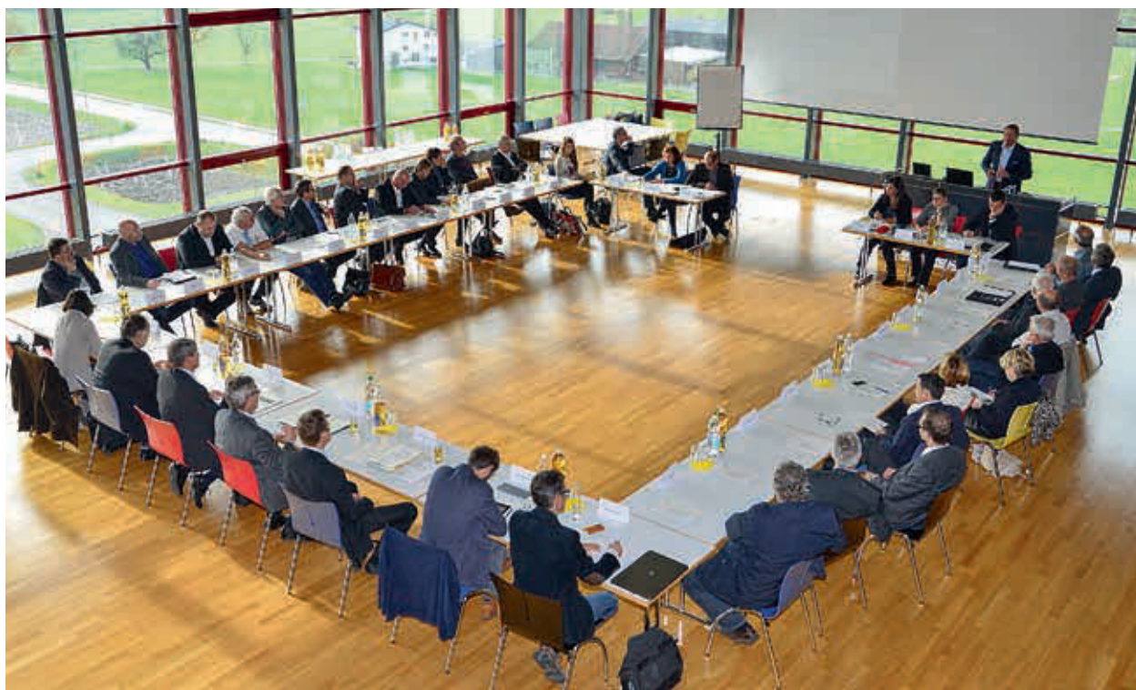
Zusammenarbeit über die Grenzen hinaus: Bürgermeister, Bürgermeisterinnen und Gemeindepräsidenten und -präsidentinnen des St. Galler und des Vorarlberger Rheintals beim grenzüberschreitenden Treffen am 10. November 2014