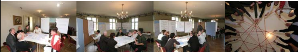
Betreuungs- und Pflegenetz Vorarlberg 20. Jänner 2009 | s8 visjon rheintal