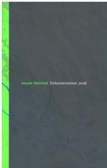
Vision Rheintal Dokumentation 2006