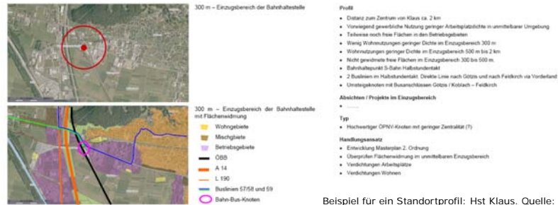
Beispiel für ein Standortprofil: Hst Klaus.

Bahnhöfe und stark frequentierte Bushaltestellen zeichnen sich durch eine hohe Erreichbarkeit aus. Es ist sinnvoll, die Areale rund um diese ÖV-Knoten zu verdichten und Einrichtungen mit hoher Besucherfrequenz (Schulen, Büros, etc.) anzusiedeln.