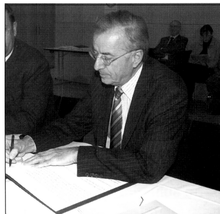
Auch Landeshauptmann Herbert Sausgruber besiegelte die Zusammenarbeit mit seiner Unterschrift.

Sausgruber und die BürgermeisterInnen der Rheintalgemeinden unterzeichneten in feierlichem Rahmen den Regionalen Kontrakt Rheintal . Festgeschrieben wurden damit die Bereitschaft zur Kooperation, die Anerkennung des gemeinsamen Leitbildes und die Fortführung von Vision Rheintal für weitere drei Jahre. „Dass 29 Gemeinden und das Land Vorarlberg ein dermaßen starkes Zeichen setzen, ist bisher einzigartig“, meint Wilfried Berchtold, Präsident des Vorarlberger Gemeindeverbandes, „eine Chance, die es zu nutzen gilt.“