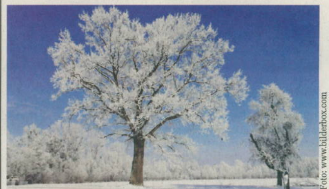
Schnee & Kälte schön und gut, irgendwann kann es dann aber auch mal wieder wärmer werden

Philipp-Stephan Schneider p.schneider@raiffeisenzeitung.at