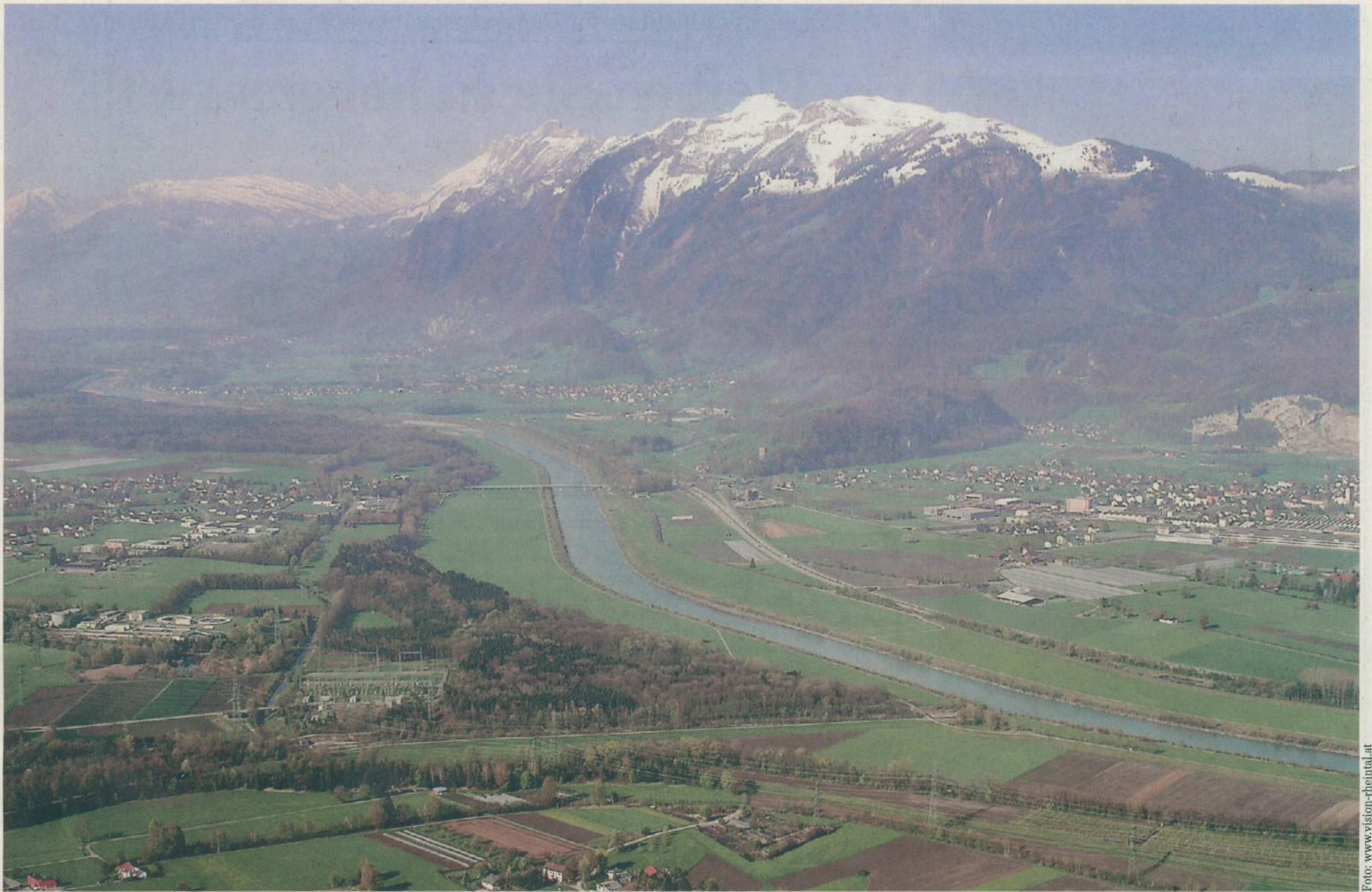
Von oben betrachtet sieht man keine Gemeindegrenzen, keine Landes- oder Kantons Grenzen und keine Staatsgrenzen, sondern nur das Rheintal als gemeinsamen Lebensraum. Im Bild: Die Vorarlberger Gemeinden Meiningen und Koblach (linkes Ufer) sowie die St. Gallener Orte Rüthi und Oberriet.

Land Vorarlberg und Kanton St. Gallen präsentieren grenzüberschreitenden Rheintalatlask