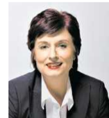
Anita Fetz ist Unternehmerin und Ständerätin