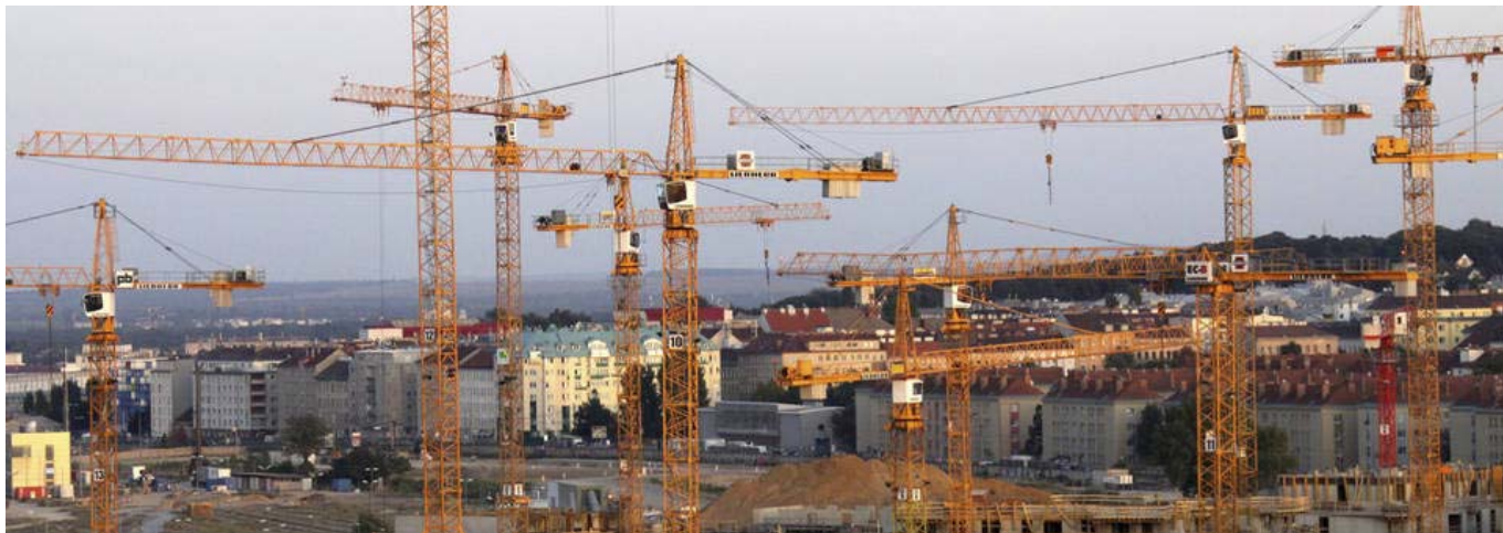
Baustelle, Baukräne - Foto: KURIER/Reinhard Vogel

Sauberes Wasser, reine Luft, intakte Wälder – die Umwelt liegt der österreichischen Bevölkerung am Herzen. Für gesunde Böden gilt das seltsamerweise bisher kaum.