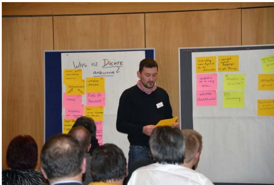
In einem Vortrag wurde die Studie zu verdichtetem Bauen in den Rheintalgemeinden vorgestellt

Von Gemeindereporter Michael Mäser am 15. März 2016 14:41