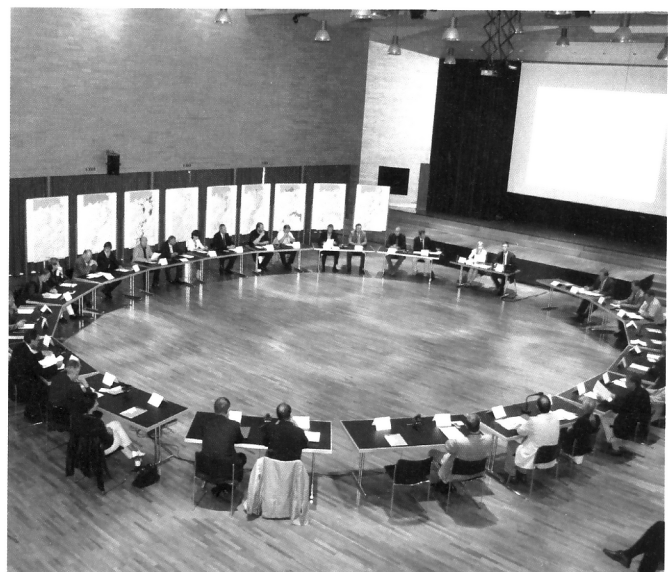
In der Rheintalkonferenz beraten die Entscheidungsträgerinnen und -träger der Landes- und Gemeindepolitik