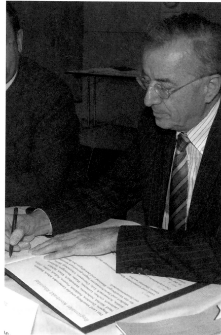
Auch Landeshauptmann Herbert Sausgruber besiegelte die Zusammenarbeit mit seiner Unterschrift.

Bei der 6. Rheintalkonferenz am 22. November 2007 unterzeichneten Landeshauptmann Sausgruber und die BürgermeisterInnen der 29 Rheintalgemeinden den Regionalen Kontrakt Rheintal. Somit ist das Bekenntnis zur Zusammenarbeit festgeschrieben.