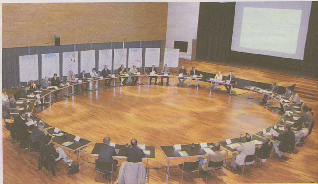
Regionaler Kontrakt Rheintal: Bei der 5. Rheintalkonferenz am 22. Mai 2007 im Wolfurter CUBUS bekräftigten das Land Vorarlberg und die 29 Rheintalgemeinden ihre Bereitschaft zur Zusammenarbeit und beschlossen im „Regionalen Kontrakt Rheintal“, gemeinsam die Verantwortung für das Vorarlberger Rheintal zu tragen.