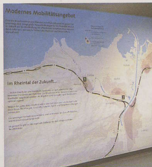
Bewusstseinsbildung: Noch bis 14. Oktober 2007 zeigt diese Ausstellung im Lustenauer Museum RheinSchauen die Hintergründe, Leitsätze und Zukunftsbilder von vision rheintal. Foren, Denkwerkstätten, Exkursionen, Roadshows, Vorträge und Publikationen sind weitere Maßnahmen, die das Projekt in möglichst vielen Köpfen verankern sollen. Weiterführende Informationen finden Sie auch unter www.vision-rheintal.at