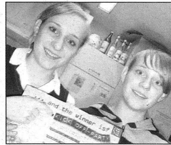
Vorfreude auf die morgige Kick-off-Party!