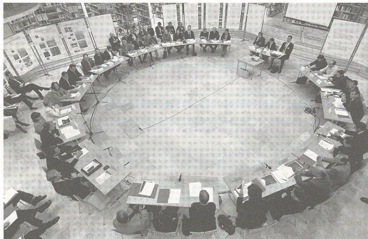
Vision Rheintal will ein Leitbild für die räumliche Entwicklung des Rheintales erarbeiten. Im Bild: 2. Rheintalkonferenz am 8. November 2005.