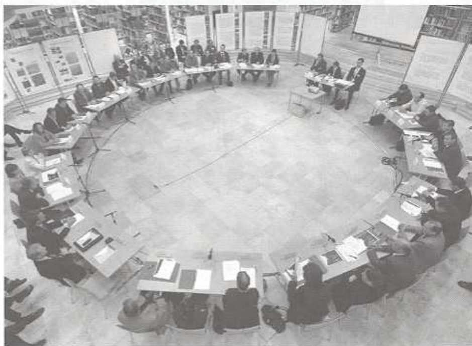
2. Rheintalkonferenz am 8. November 2005.

Ballungsräume weist das Rheintal bereits als „Stadtregion“ aus. Nach Beurteilung von Experten sollen die „Region Rheintal“ real bereits existieren und die sozialen Aktivitäten der Bevölkerung die Grenzen der jeweiligen Heimatgemeinde längst überschritten haben, wenn auch die Grenzen der