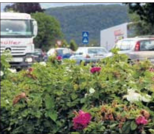
Nahverkehr: Feldkirch Nord / Rankweil.