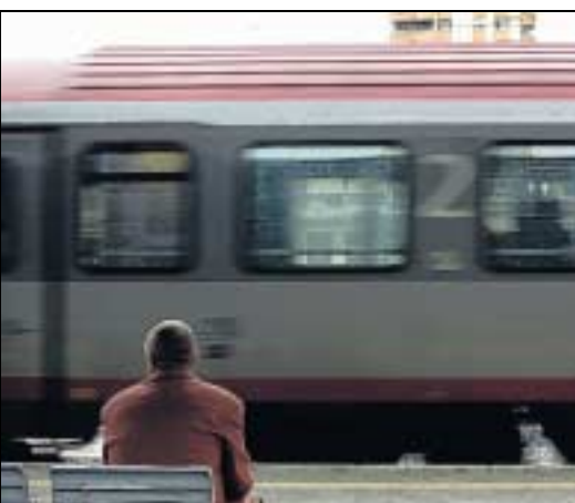
Fernverkehr: Bahnhof Feldkirch.