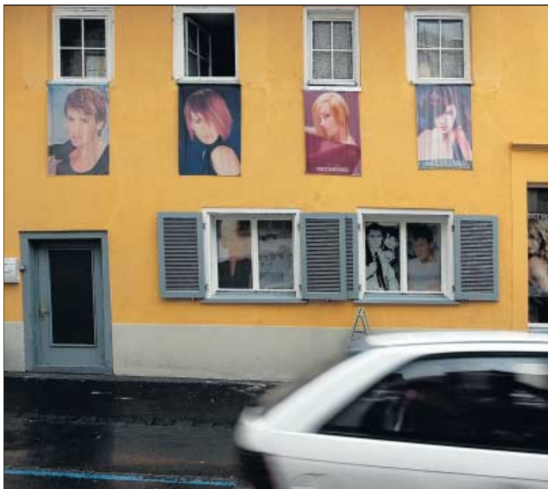
Farbtupfer: Parade von Frisuren auf gelbem Grund in Hohenems.