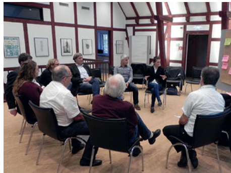
Fokusgruppen Herbst 2016