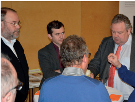
Frühjahr 2016: Workshops in den Regionen

Im bisherigen Prozess zeichnen sich klare Trends ab: Die Euphorie der Anfangsjahre ist der Realität des Alltags gewichen. Doch bei aller Kritik an Vision Rheintal besteht der Wunsch nach weiterer, gemeindeübergreifender Zusammenarbeit. Kleine und mittlere Gemeinden wünschen sich mehr Unterstützung, wenn es um Raumplanung geht, während für größere Kommunen verstärkt soziale Themen eine zentrale Rolle spielen. In Zukunft braucht es eine stärkere Kommunikation in die Gemeinden hinein, besonders die Mitglieder der Gemeindevertretung bzw. der Planungsausschüsse sollen besser angesprochen werden. Ein spezielles Angebot benötigen die Gemeinden in Rand- und Hanglage. Diese wurden in der Vergangenheit nicht ausreichend von Vision Rheintal mitgenommen.