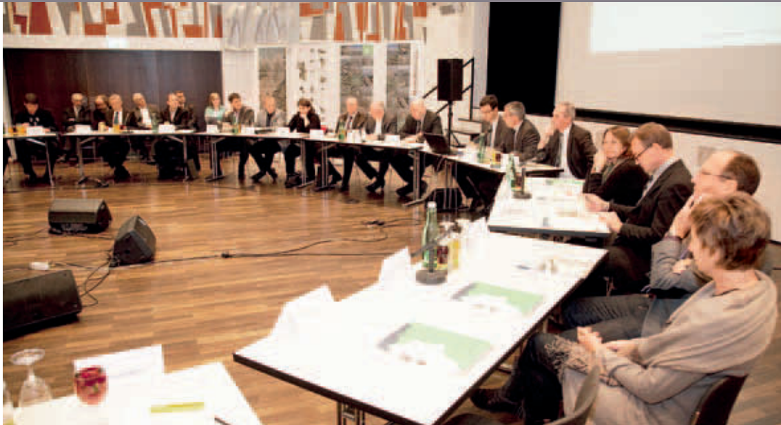
Die 9. Rheintalkonferenz fand am 17. November 2009 im Vinomnasaal Rankweil statt.