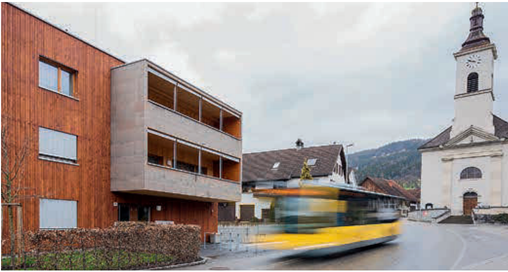
Gemeinnütziger Wohnbau heute: Im Jahr 2010 wurde gleich neben der Kirche mitten im Dorfkern von Satteins eine kleine Anlage mit 11 Wohnungen fertiggestellt – barrierefrei und in Passivhausqualität.