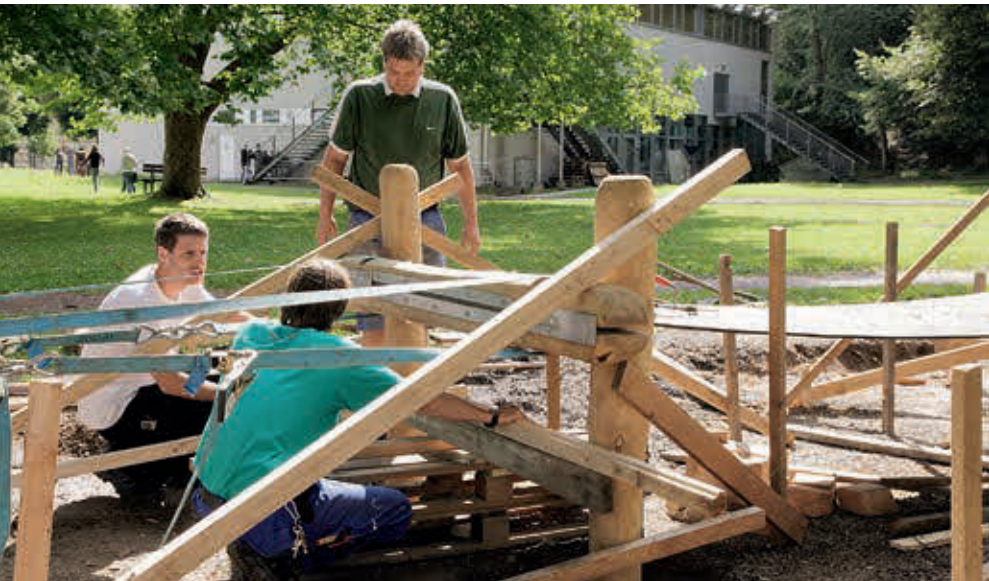
ABF-Mitarbeiter beim Bau des Spielplatzes im Feldkircher Reichenfeld.